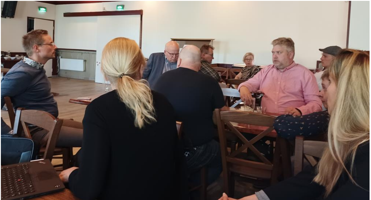
Ryhmätöiden pohdinnat purettiin yhdessä ja niistä keskusteltiin vilkkaasti.

Maatalouden roolia pohdittiin myös ilmaston lämpenemisen sopeutumisen näkökulmasta. Se voi mahdollistaa uusia kasvilajeja, mutta myös lisää sääolosuhteiden ääri-ilmiöitä kuten sateita ja kuivuutta. Niiden mukana näennäinen tuotantopotentiaalin kasvu jopa uusien kasvilajien muodossa voi kompensoitua negatiivisesti säävaihtelujen muodossa.