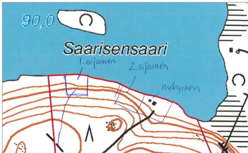
Karttaote: Suuri-Saarinen, tilan 768-412-1-28 rantavyöhyke.

Vastine: Kaavan laatija on selvittänyt asiaa ja todennut, että kyseessä on kaksi tilaa, joilla on yhtenevä maanomistus. Rantayleiskaavan laadintaperiaatteiden mukaisesti maanomistussyksikön rantarakennusoikeus määritetään kokonaisuutena, eli tilojen alueella muodostunut rantarakennusoikeus lasketaan yhteen ja rakennusoikeus voidaan sijoittaa soveltuvimpaan paikkaan.